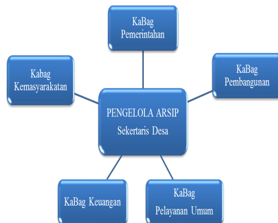
Bagan 1. Alur Pengarsipan Dokumen di Desa Temuwuh

Namun demikian pengelolaan arsip masih dilakukan secara manual dan beum